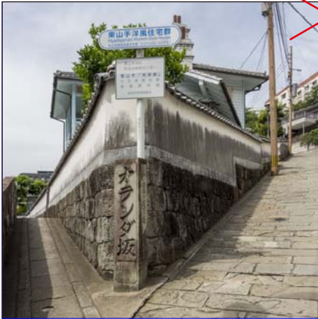
4mm オランダ坂 Dutch Slopes ( ' 14.05)