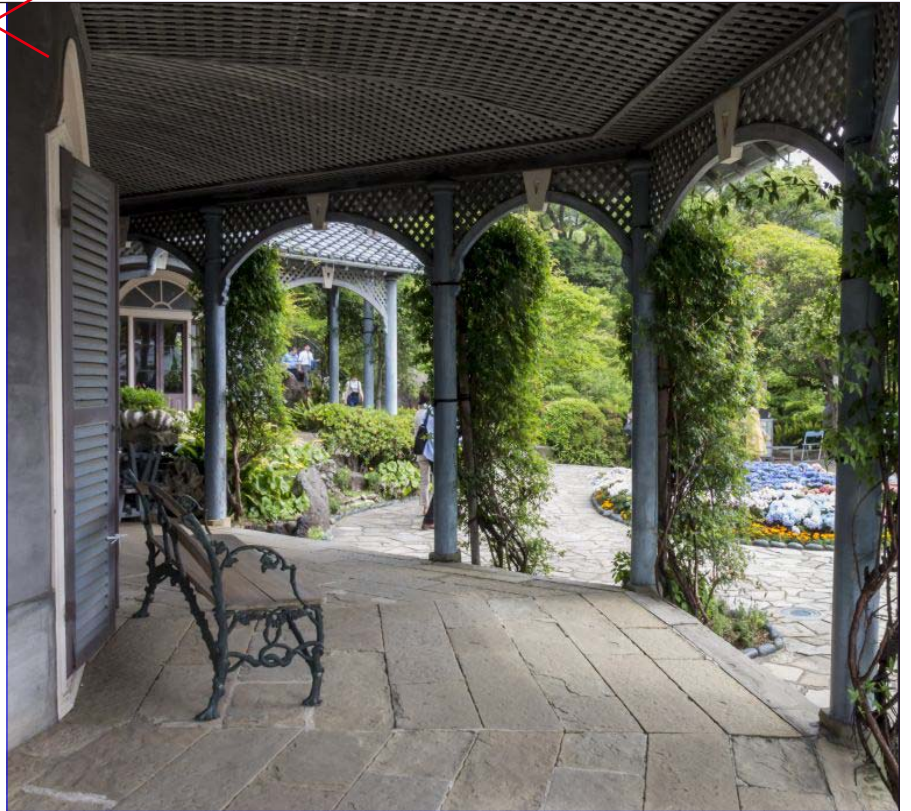
グラバー邸 Glover's house ( ' 14.05)