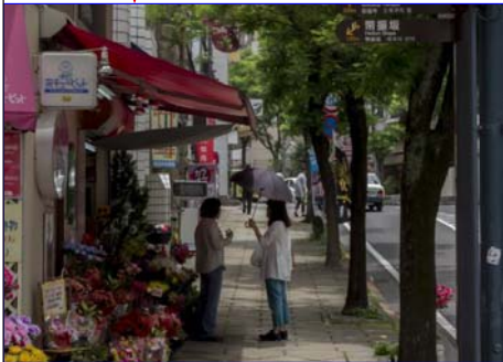
4mm 街路 Street ( ' 14.05)